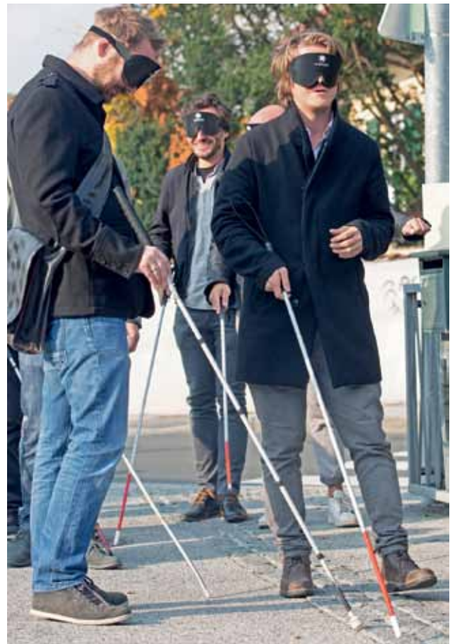
Architektengruppe NEXT Generation

Im Rahmen des „Tag des weißen Stocks“ besuchte am 19. Oktober 2018 die Architektengruppe NEXT Generation den BSVS: Sie erleben im Blindenzentrum, wie es sich anfühlt, blind oder mit dem Rollstuhl unterwegs zu sein, welche baulichen Voraussetzungen es braucht, um gut und sicher voranzukommen und was Barrierefreiheit bedeutet. Salzburg heute (ORF Salzburg) war live dabei.