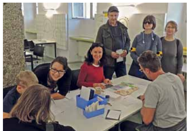
Kreativ im Haus der Natur

Am 14. Oktober 2018 fand eine weitere Aktion im Zuge des „Tag des weißen Stocks“ statt: In der „Braille-Kreativwerkstatt“ lernten Besucher die Brailleschrift kennen. Sie konnten das eigene Handy mit Botschaften verzieren oder ein Tattoo in Brailleschrift entwerfen.