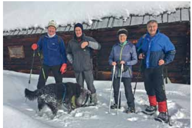
Gemeinsames Schneeschuhwandern am Preber

Nicht zuletzt ist der BSVS auch ein Ort der Gemeinschaft. Gemeinsames Erleben stärkt das Selbstbewusstsein und gibt Freude am Leben. Deshalb bieten wir ein großes Freizeitprogramm: vom Trommelworkshop über einen Bastelkurs und den Stammtischen bis zu kulturellen Angeboten wie Theaterbesuche oder Konzerte.