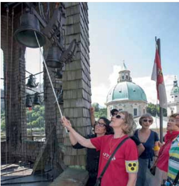
Das Glockenspiel kennenlernen

Am Tag der Sehbehinderung (6. Juni) haben wir in Kooperation mit dem Salzburg-Museum das Glockenspiel besucht. Dazu eingeladen waren Journalisten: „Einmal Höhenluft schnuppern und die Geräusche der Stadt von oben hören, vor allem aber die jahrhundertealte Mechanik des Salzburger Glockenspiels ertasten und verstehen. Diesen Wunsch konnten sich Mitglieder des Blinden- und Sehbehindertenverbandes Salzburg [...] erfüllen. Das Salzburg-Museum veranstaltete einer ihrer zahlreichen inklusiven Kunstvermittlungangebote“, hieß es in der Presseinformation.