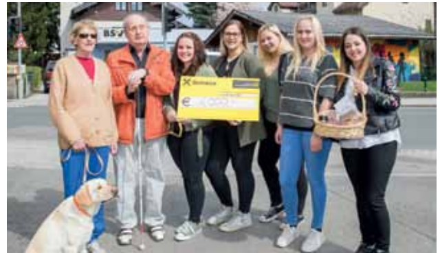
Danke an die Schülerinnen der LBS St. Johann

Über zwei Spendenübergaben wurde 2018 medial berichtet: Im Februar überreichten Mitarbeiter der Drogeriekette dm 2.700 Euro an den BSVS. Vielen Dank dafür! Ebenfalls großartig: Die Projektidee von fünf Schülerinnen der Landesberufsschule St. Johann. Sie organisierten im April ein Benefizkonzert der Großarler Mitterling-Buam – 2.000 Euro übergaben sie dem BSVS. Auch dafür herzlichen Dank!